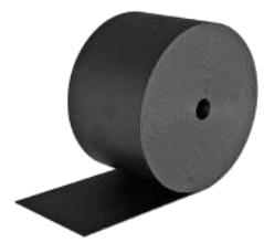
MANICA FLEX Seite 148