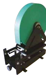
LIZARD Seite 388