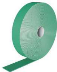
NAIL PLASTER Seite 134