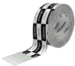
FLEXI BAND Seite 78